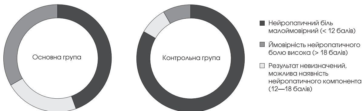
Рис. 2. Порівняння результатів за опитувальником rainDETECT у групах

6 (33,3 %) пацієнтів основної групи, у контрольній групі — лише в 1 (8,3 %).