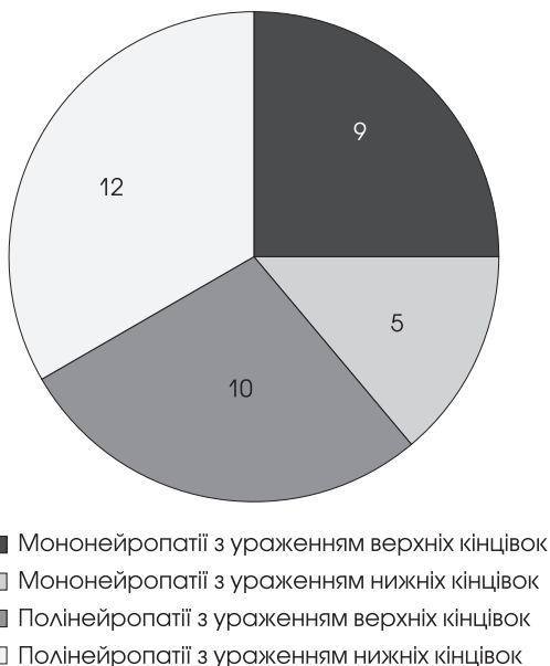
Рис. 3. Частота різних варіантів ураження ПНС у хворих на РРРС

тіше (у 24 (80 %) пацієнтів), ніж зміни на ЕНМГ (у 18 (60 %)). У 6 (20 %) пацієнтів були скарги на оніміння та зниження вібраційної чутливості при неврологічному огляді, але результати нервової провідності не відрізнялися від норми. У 5 (16,7 %) пацієнтів без скарг на ураження ПНС виявлено субклінічні вияви периферичної нейропатії у вигляді сповільнення ШПЗ. У пацієнтів із високою ймовірністю нейропатичного болю ( \geq 18 балів) зареєстрували статистично значуще зниження ШПЗ по сенсорних і моторних волокнах ( p < 0,05 ; r_s = -0,374 ).